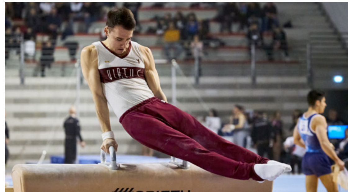
A.S.D. Virtus Pasqualetti - VLADYSLAV HRYKO Ginnasta della nazionale ucraina finalista alle Olimpiadi di Rio 2016.